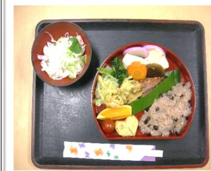
昼食*松花弁当と夏メニューの中華定食です