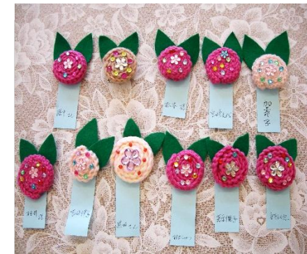
手芸教室*ブローチ作り